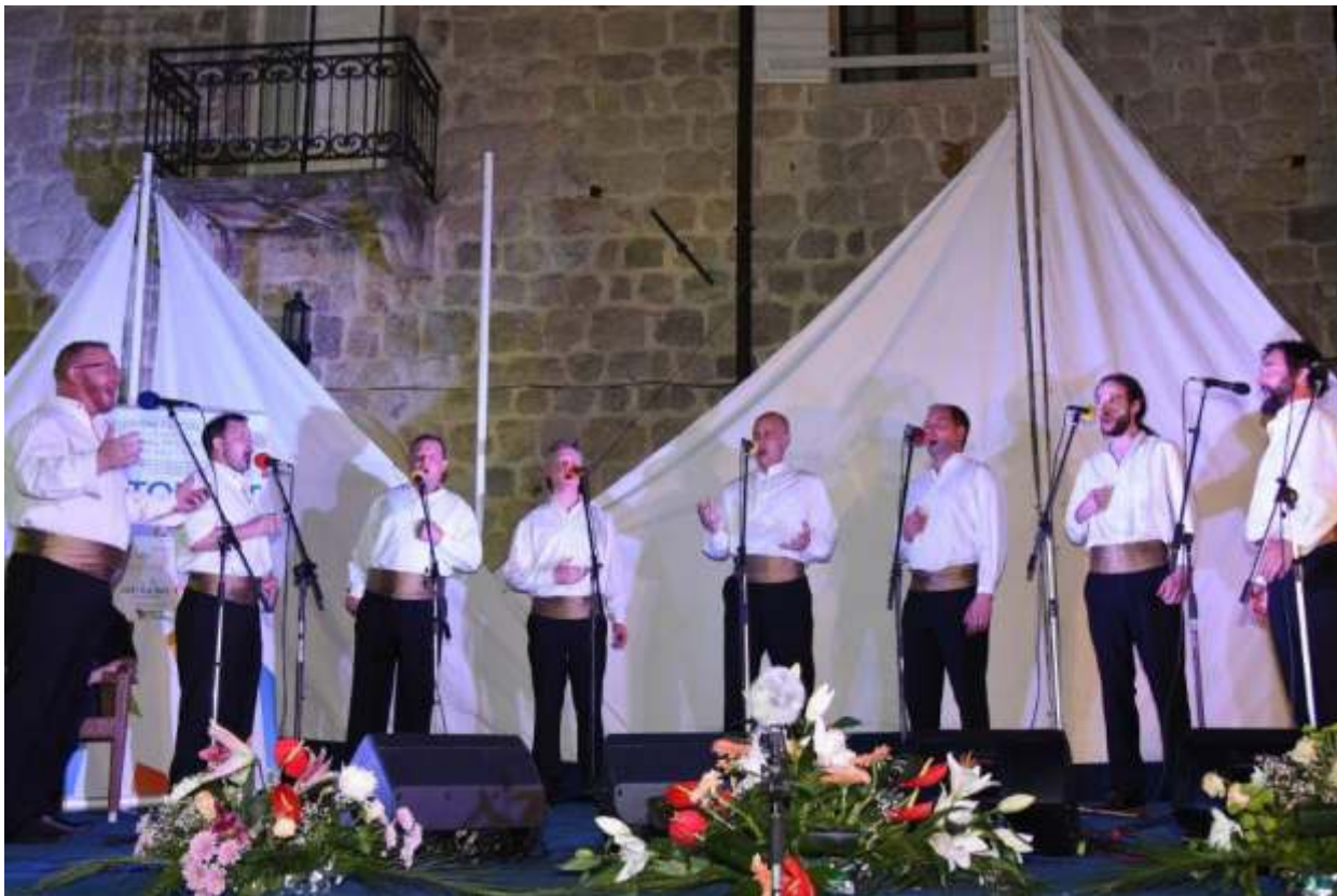
Pinguentum – Buzet

Dodjelom nagrada u subotu, na centralnom peraškom trgu, Pjaci Svetog Nikole, završen je XVI Međunarodni festival klapa Perast.