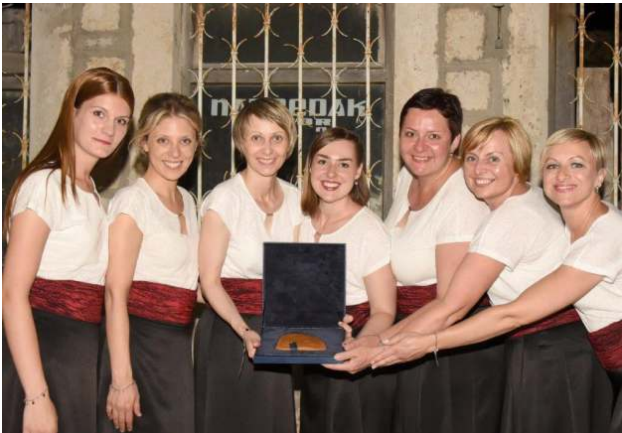
Stentorija - Daruvar

„Nakon svega onoga što smo svi imali priliku da vidimo u proteklih par mjeseci, moje je zadovoljstvo da smo uspjeli sve ovo da realizujemo u mnogome veće. Kada je u vrijeme najvećeg zla koje je zadesilo našu planetu neko upitao tadašnjeg premijera Velike Britanije Čerčila da smanji davanje za kulturu u vrijeme rata a da poveća davanje za vojsku, on je odgovorio da ako to urade šta će im ostati da brane. Vjerujem da smo braneci pravo da Perast ima Festival klapa, braneci pravo da Kotor ima Festival pozorišta za djecu i Don Brankove dane muzike, odbranili pravo da Boka ima svoju kulturu i svoju posebnost“, kazao je Jokić.