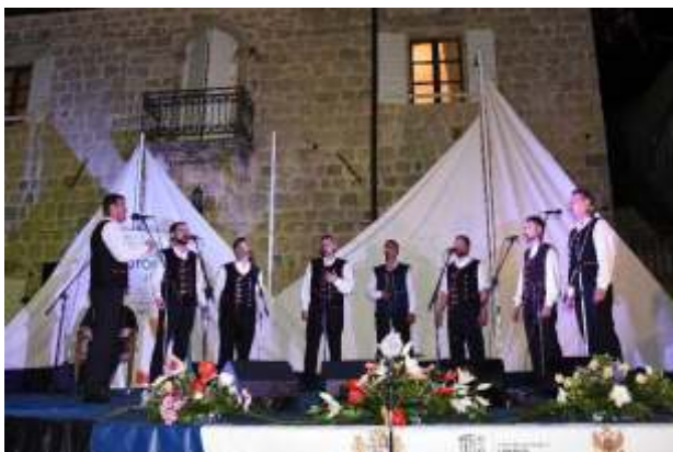
Jacera - Šibenik