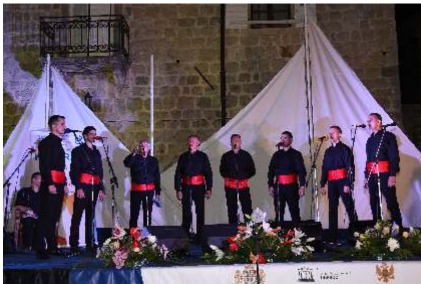
Asa voce - Podgorica

Nagrada publike u kategoriji muških klapa pripala je klapi Asa voce iz Podgorice sa pjesmom „Pod odrinom“.