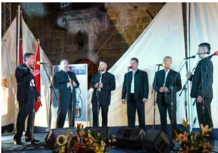
Valdibora - Rovinj, I mjesto u kategoriji muških klapa

Dodjelom nagrada u subotu 30. juna, na Pjaci Svetog Nikole u Perastu, završen je XVII Međunarodni festival klapa Perast.