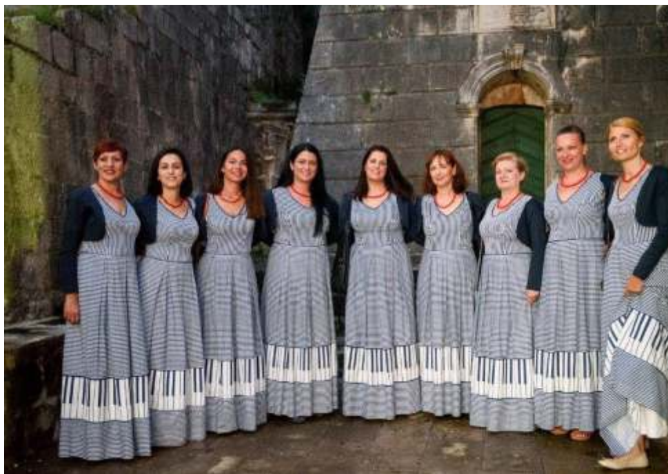
Mirabela - Omiš