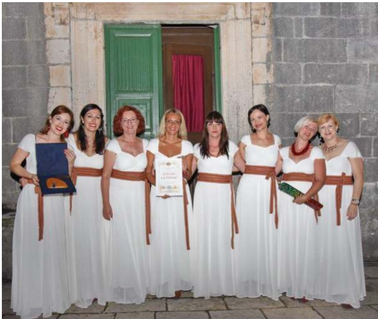
Skontradura-Dubrovnik, Zlatni "Peraški kampanio"

U takmičarskom dijelu u kategoriji ženske klape XVII Međunarodnog festivala klapa Perast, prvo mjesto po ocjeni žirija pripalo je klapi Skontradura iz Dubrovnika, drugo klapi Peružini iz Paga, a treće klapi Diva iz Širokog Brijega.