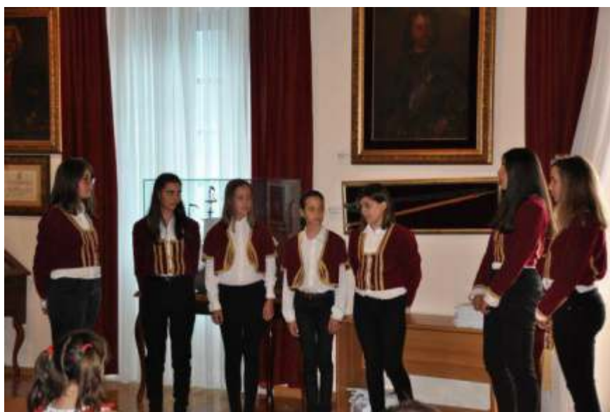
Sa promocije Lirice br. 6 PRIMORKINJE - Budva

U muzičkom dijelu programa nastupile su dječija klapa Kotorski gardelini i dječiji hor Primorkinje iz Budve.