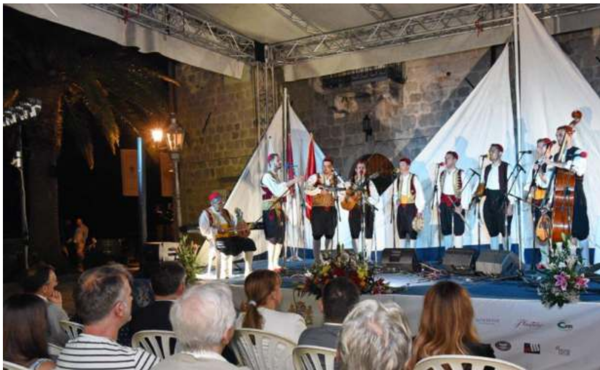
Kaše – Dubrovnik izvode himnu MFK Perast “Slava Perasta”

Uz crkvena zvona i himnu Festivala klapa „Slava Perasta“ u četvrtak 28. juna na Pjaci Svetog Nikole u Perastu svečano je otvoren XVII Međunarodni festival klapa, čime je ujedno označen i početak ovogodišnjeg programa KotorArta.