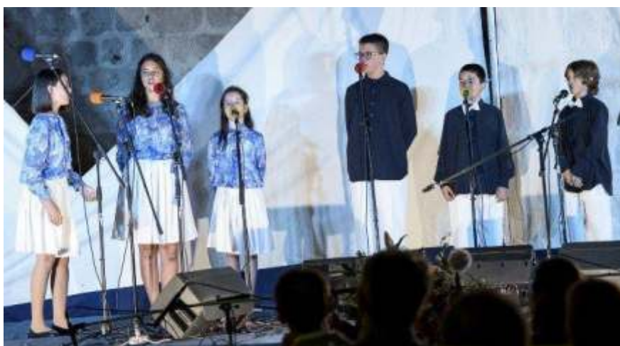
Najmlađi, na XVII MFK Perast: Kotorski gardelini