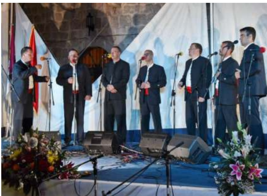
Praska – Podstrana, najbolja klapa po ocjeni publike

U kategoriji muških klapa, prvu nagradu po ocjeni stručnog žirija, osvojila je klapa Valdibora iz Rovinja kojoj je pripala nagrada „Peraški kampanio“. Drugo mjesto pripalo je klapi Porat sa Korčule, treće mjesto osvojila je klapa Žmul iz Omiša.